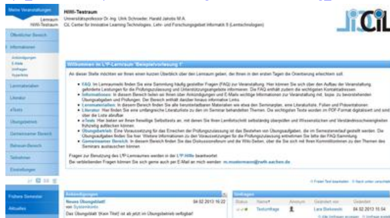
Abb. 2: Screenshot Orientierungshilfe Freitextbereich unter „Informationen“